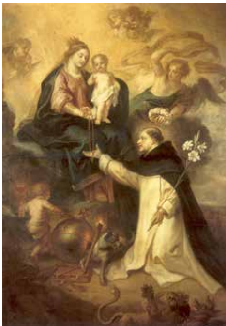
De H. Dominicus ontvangt de rozenkrans uit handen van Maria (1654). Van de zuidnederlandse barokschilder Theodoor van Thulden.